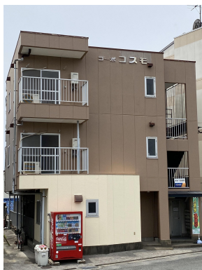
[外観・現況][外観写真]