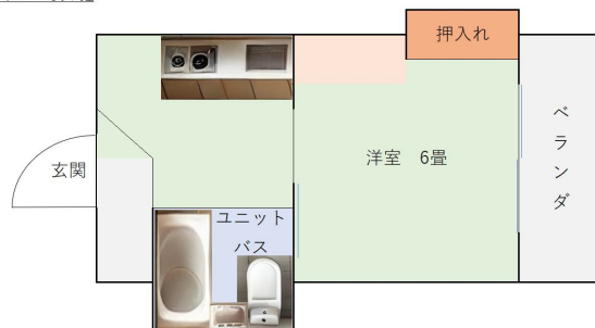
[間取り図・図面][間取り図]