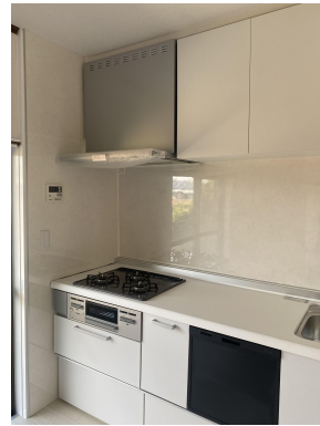
システムキッチン新設