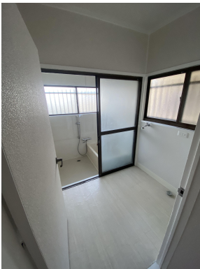
シャワーバー付き