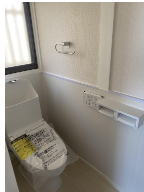
節水型トイレ新設